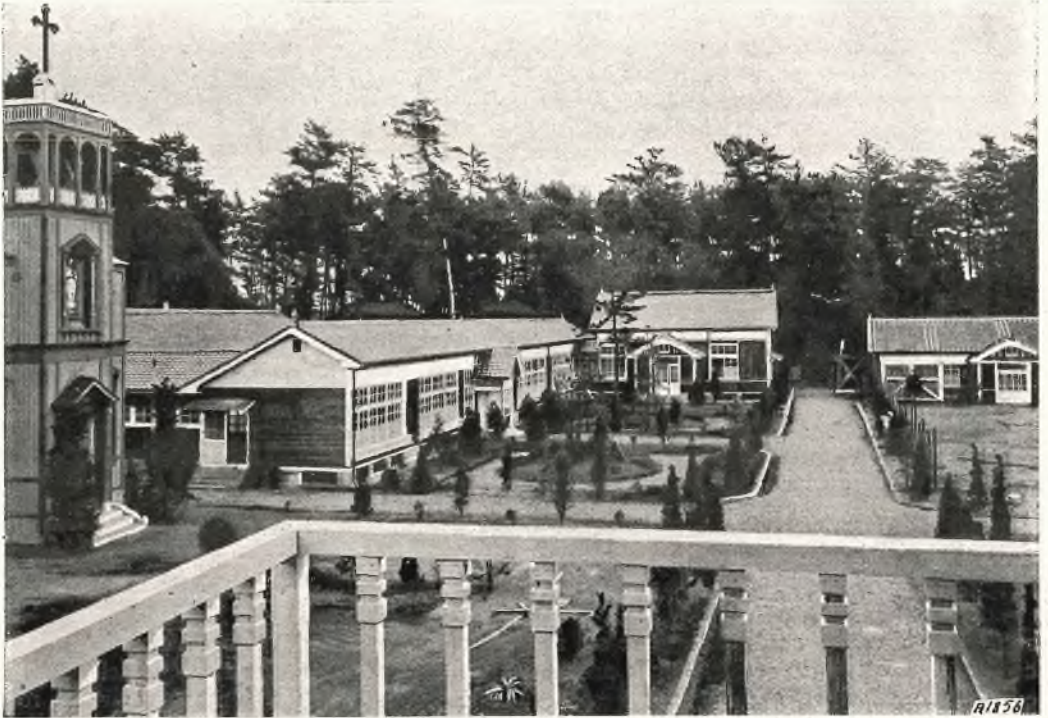
Miyazaki - Panorama della Missione Salesiana.