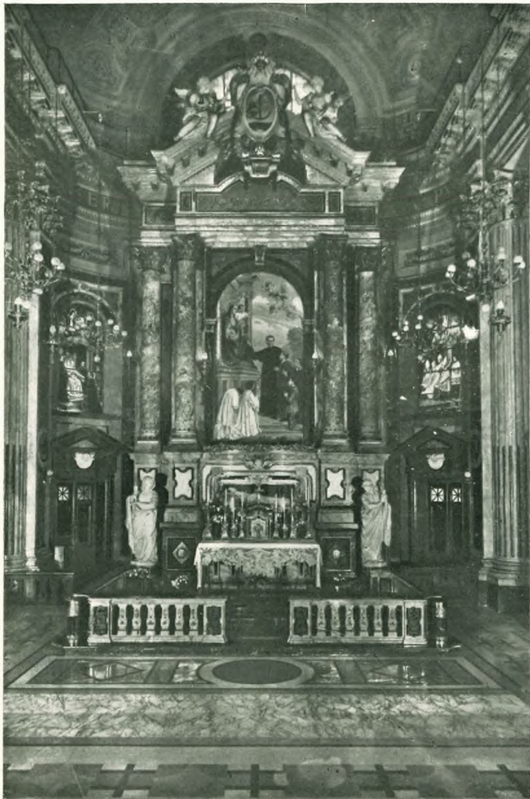
TORINO - BASILICA DI MARIA AUSILIATRICE: L'altare di S. Giovanni Rosco con la nuova pala.