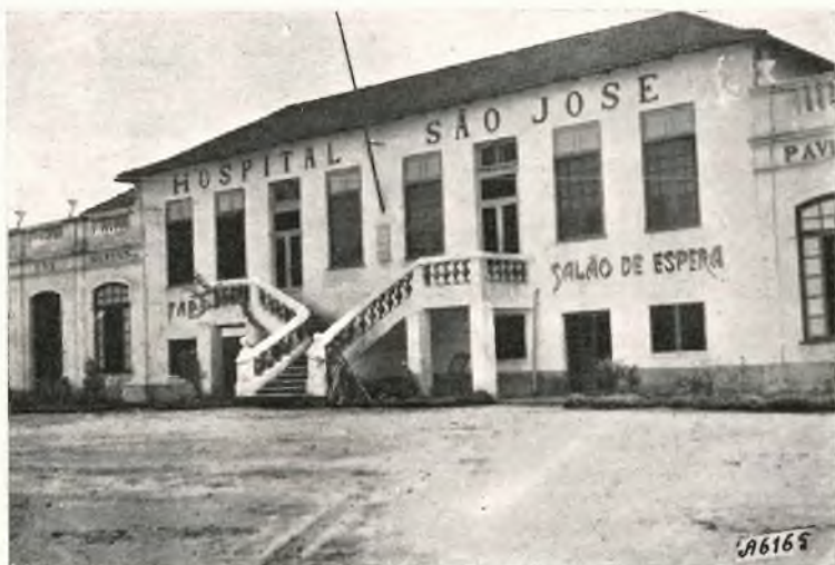
Porto Velho - L'Ospedale S. Giuseppe.

Le noto di passaggio che, nel prossimo dicembre, da questa Scuola uscirà il primo gruppo di nuove insegnanti. Presiederà il conferimento