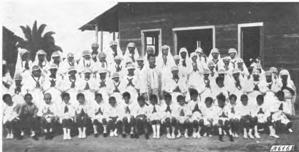
Porto Velho - Prime Comunioni.

sare per un momento alla posizione del Giappone d'oggi nel mondo; basta considerare lo sviluppo della sua vita, della sua cultura e del suo spirito. E quel che più importa è capire che il Giappone non intende chiudersi a quanto gli sembra progresso; ma polarizza sempre più in alto le sue aspirazioni nazionali. Le sue forti tradizioni, che vengono mirabilmente adattandosi alle esigenze del momento,