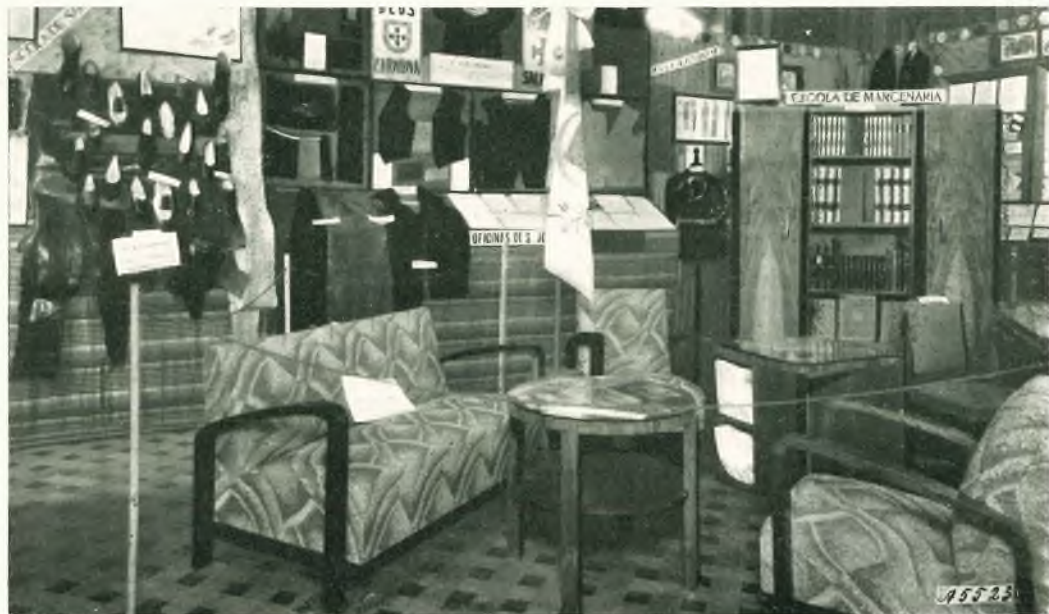
Lisbona - Lavori delle Scuole Professionali Salesiane.

E qui si avverta che la carità e la purezza devono apparire all'esterno come irradiazione di buon esempio. Fu ripetuto spesso che, nell'opera educatrice, l'esempio è tutto o quasi tutto. Il contrasto tra la vita e la parola di chi insegna toglie purtroppo alla dottrina insegnata gran