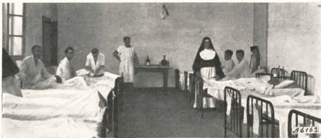
Porto Velho - Una corsia dell'Ospedale S. Giuseppe.