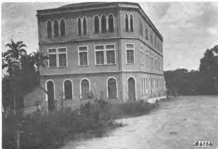
Porto Velho - La Scuola Magistrale diretta dalle Figlie di Maria Ausiliatrice.

Che fare? Quanti centri domandano la visita del Missionario, mentre noi non abbiamo la possibilità di compierla! Da poco la Prelatura eresse diverse scuole rurali e stà costruendo varie Cappelle col concorso del popolo. Dall'Interventore di Manaus si ottenne la nomina ufficiale di Ispettore Scolastico pel Missionario itinerante; ma pressanti ragioni hanno costretto a differire il viaggio per venir in