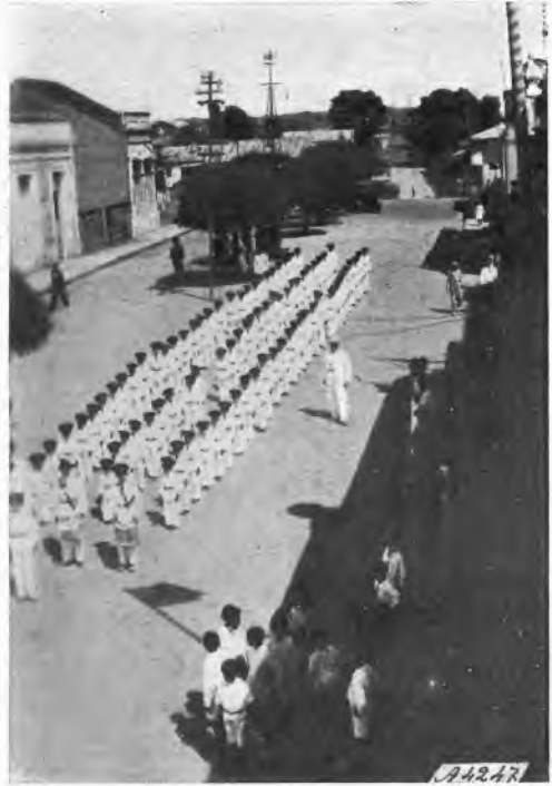
Porto Velho - Lo schieramento degli alunni del Collegio Salesiano.

Il giorno 15, domenica, alle 7,30 del mattino, prima che si rimettesse a bordo del suo apparecchio, tornai ad ossequiarlo, presentandogli