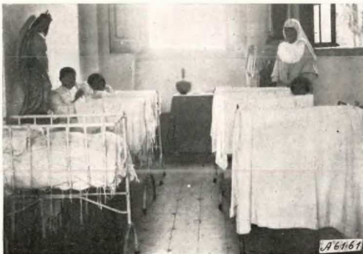
Porto Velho - L'infermeria per i bambini.

Si ricorderà tuttora dell'ampia relazione da me inviatale quando, nel 1936, in una temeraria escursione di sei mesi, mi lanciai in queste vaste